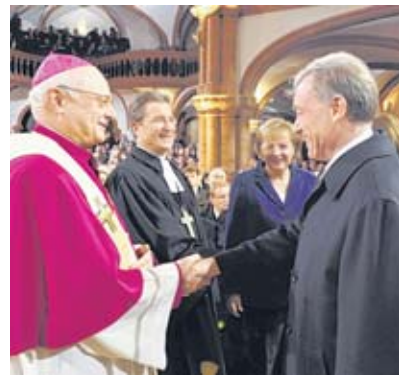
Bundespräsident Horst Köhler (r.) in der Gethsemane-Kirche