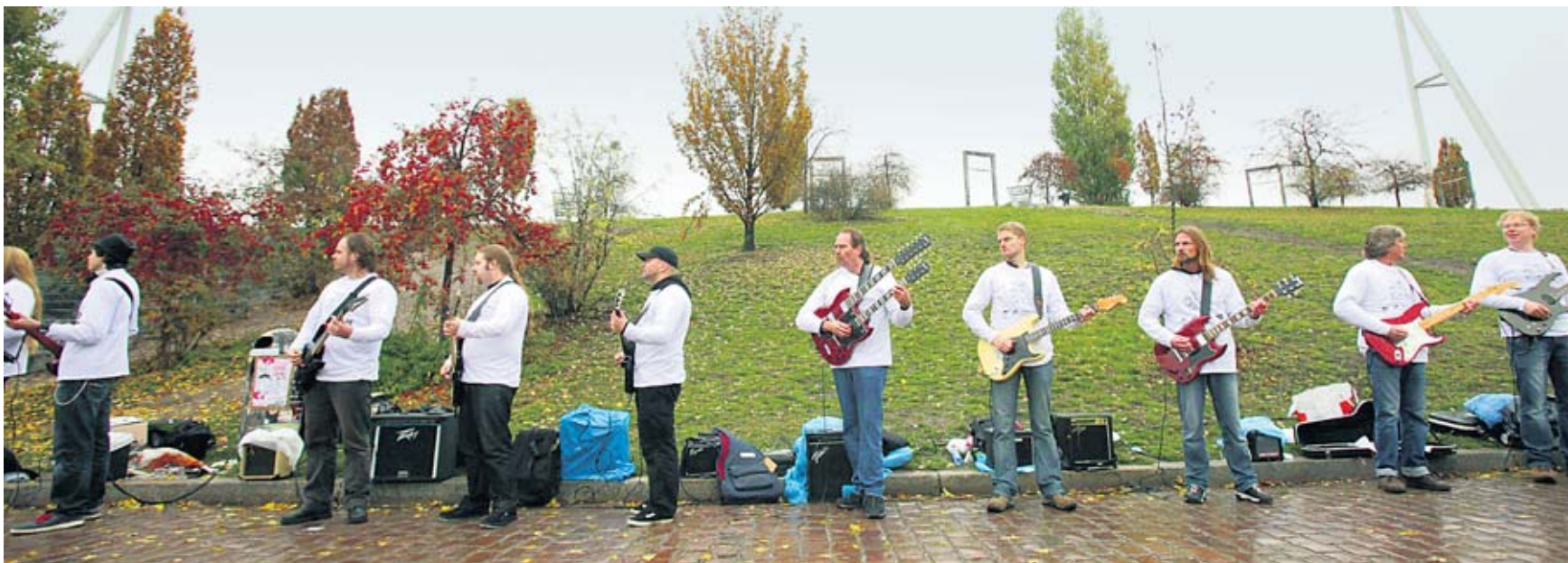
Rund 100 Gitarrenspieler bilden eine symbolische „Klang-Mauer“ im Berliner Mauerpark an der ehemaligen Grenze zwischen Wedding und Prenzlauer Berg