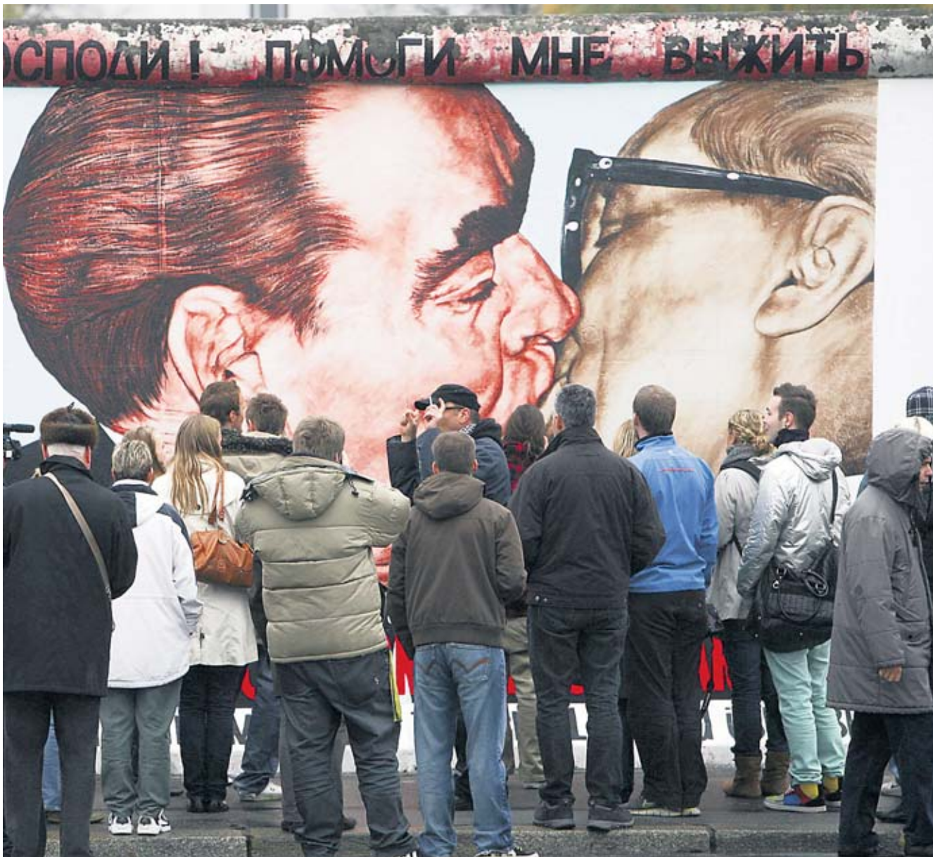
Völker der Welt, schaut auf diese Mauer: Touristen vor dem Bruderkuss an der East Side Gallery